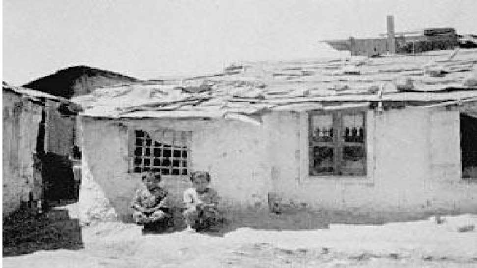
Προσφυγικός συνοικισμός, Αθήνα.

Στο πλαίσιο της αστικής αποκατάστασης, η ΕΑΠ συνέχισε την αξιοποίηση κατοικιών που είχαν ανεγερθεί ή προγραμματιστεί να οικοδομηθούν από το Ταμείο Αρωγής και αφορούσαν περιοχές της Αθήνας, του Πειραιά, της Ελευσίνας, του Βόλου και της Έδεσσας. 76 Συνολικά οικοδομήθηκαν 16.700 κατοικίες, συγκεντρωμένες σε συνοικισμούς, εκ των οποίων οι σημαντικότεροι ήταν της Καλαμαριάς και της Τούμπας στη Θεσσαλονίκη. 77 Μεγάλος αριθμός κατοικιών οικοδομήθηκε από τους ίδιους τους πρόσφυγες με τη βοήθεια της ΕΑΠ, η οποία παρείχε υλικά και χρήματα. 78