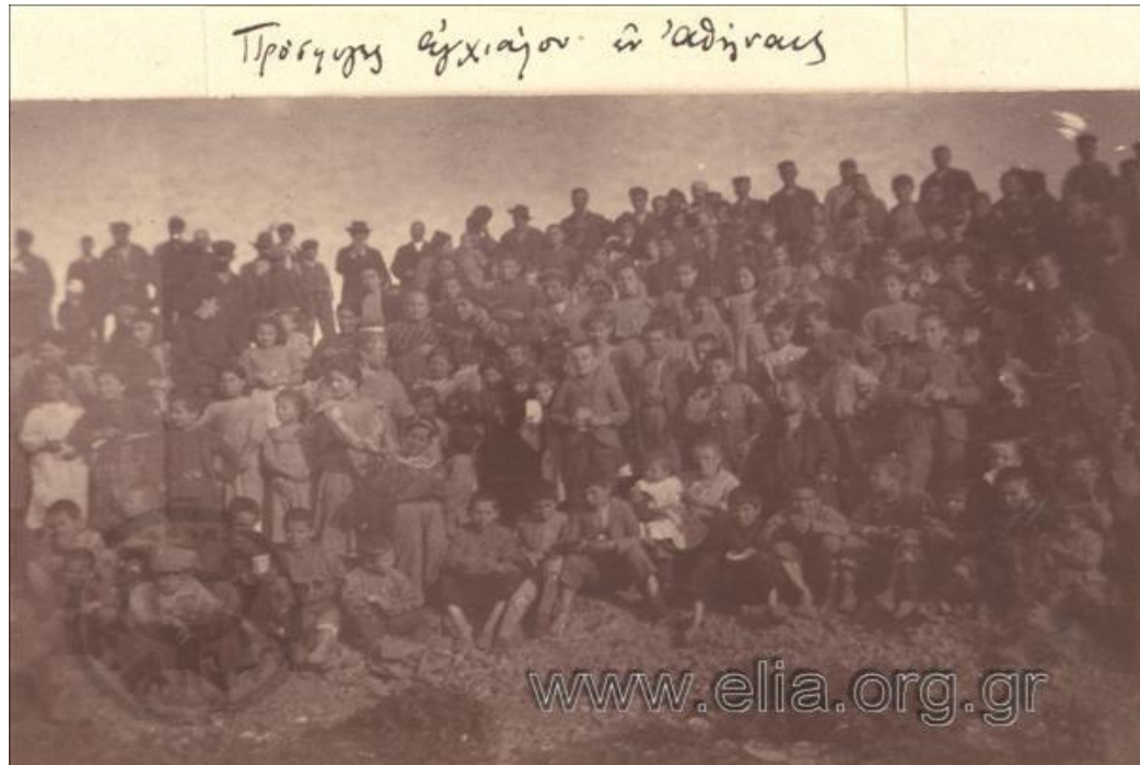
Πρόσφυγες από την Αγγιάλο σε κάποια αλάνα το 1910.

Σε καμία περίπτωση ωστόσο δεν γνωρίζουμε τα συνολικά ποσά που συγκεντρώθηκαν, τον αριθμό των προσφύγων που υπήρξαν λήπτες των δωρεών και τα κριτήρια των χορηγούμενων παροχών. 42 Επίσης, οι αναφορές για τις κινήσεις της ιδιωτικής φιλανθρωπίας παρουσιάζουν μεγάλη ποικιλία ανά γεωγραφική περιοχή, γεγονός που μαρτυρά τη διαφορετική αντιμετώπιση των Αγγιαλιτών προσφύγων ανάλογα με τον τόπο που βρέθηκαν (αστικά κέντρα, επαρχία, νησιά). Με άλλα λόγια, οι Αγγιαλίτες αντιμετώπισαν μια διαφοροποιημένη εκδοχή της «κοινωνικής ιδιότητας» του πολίτη ανάλογα με τον τόπο εγκατάστασης και τις ιδιαίτερες κοινωνικές συνθήκες. Η κατ' οικονομία και κατ' επείγον αντιμετώπιση του προσφυγικού θέματος από την Πολιτεία συναντούσε την περιστασιακή και ευμετάβλητη ιδιωτική φιλανθρωπική δράση με κοινό παρανομαστή την έλλειψη μιας ελάχιστης και αξιοπρεπούς προνοιακής κάλυψης.