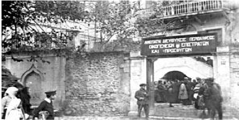
Ανώτατη Διεύθυνση Περιθάλψεως Οικογενειών, Επιστράτων και Προσφύγων, Αθήνα.